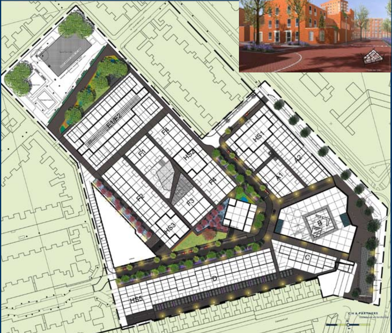
inrichtingsplan eerste fase